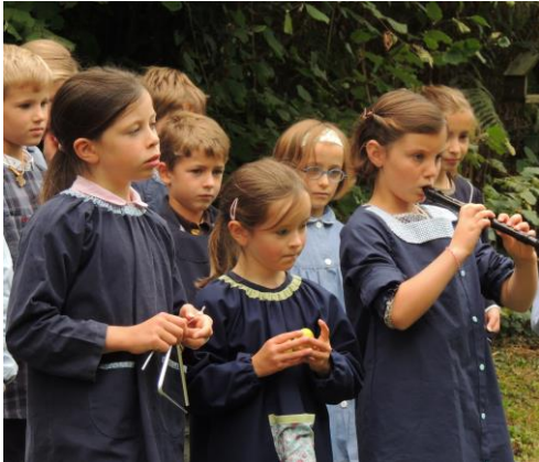
Le concert de bienvenue pour les nouveaux élèves.