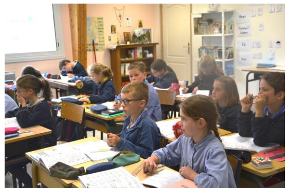
Je suis attentif et concentré pour comprendre les leçons et savoir les restituer.