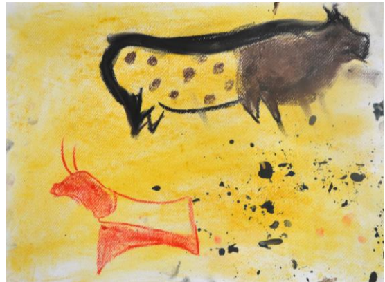
Cours d'Art et cours d'Histoire se font écho.