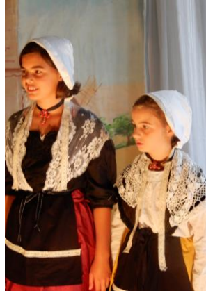
Un spectacle de fin d'année très attendu !