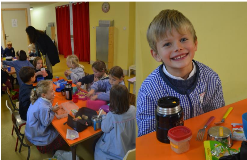
C'est l'heure de sortir son panier-repas. Chaque jour, trois parents et une maîtresse assurent la surveillance de la cantine.

Clarisse P, maman de trois enfants de l'école :